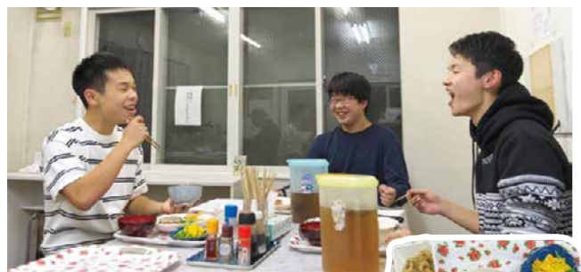
▲下宿には、高校生の他に大学生の方も入居中。食事の時間に顔を合わせることも多く、仲良くしてもらっているそう。