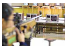
▲高校から始める人が多い射撃。なかなかできない体験だったのも、入部の決め手でした。