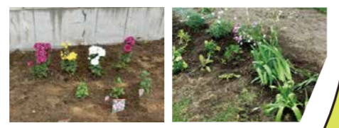
▲花壇作りは、PTAの方にもお手伝いいただきました。チューリップ、すいせん、マーガレット、ジャーマンアイリス…などさまざまな花が校舎周辺を彩りました。

北科大高生の学校生活を 紹介する「ACTIVO(アクティボ)」。 部活動から高校生の毎日を応援する サポーターまで幅広くご紹介！