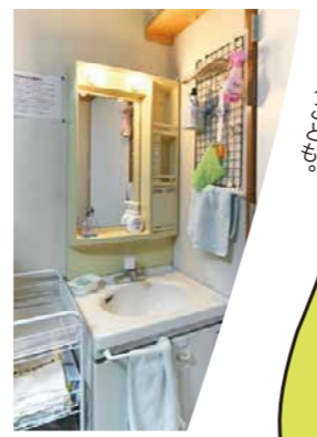
▲室内に洗面台があり、使い勝手も◎。