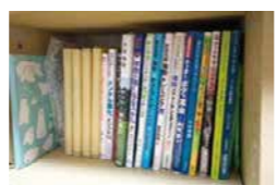
▲サッカーに関するトレーニングの本も集めています。